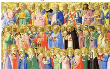
Terceira Exortação Apostólica do Papa Francisco sobre o chamamento à santidade no mundo atual

O Papa Francisco vai publicar uma Exortação Apostólica dedicada à “santidade no mundo contemporâneo”, anunciou a Santa Sé.